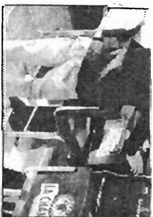
Slot machine in un bar

Con telecomandi di Cividale per tutto aggiravano. riusciva a interferire con il software delle slot machine: schiacciava un pulsante e, pur in assenza della combinazione vincente, dava l'impulso per aprire la cassa. Domenica po- meriggio, in pochi minuti, a Cividale ha "vinto" con questo sistema 290 euro.